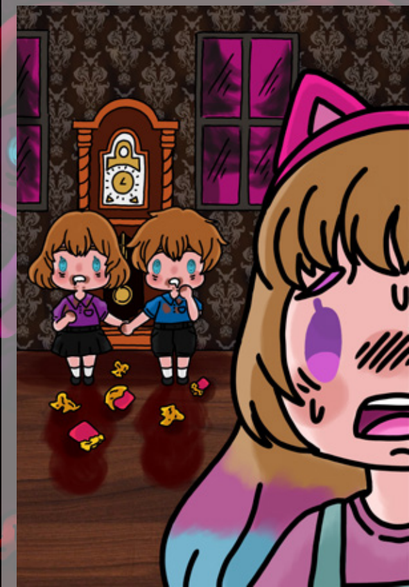
Personajes y Fondo