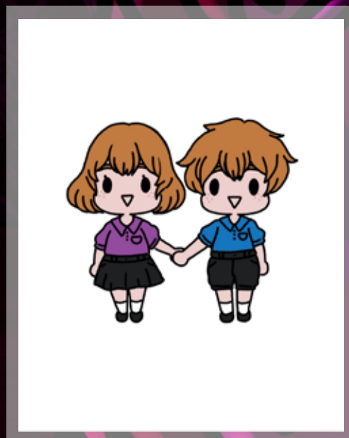
Resultado de coloreado